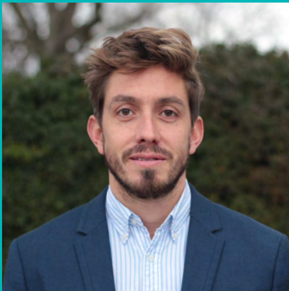
Gerente Senior de Programa, Democratizando Innovación en las Américas (DIA) Senior Program Manager, Democratizing Innovation in the Americas (DIA)